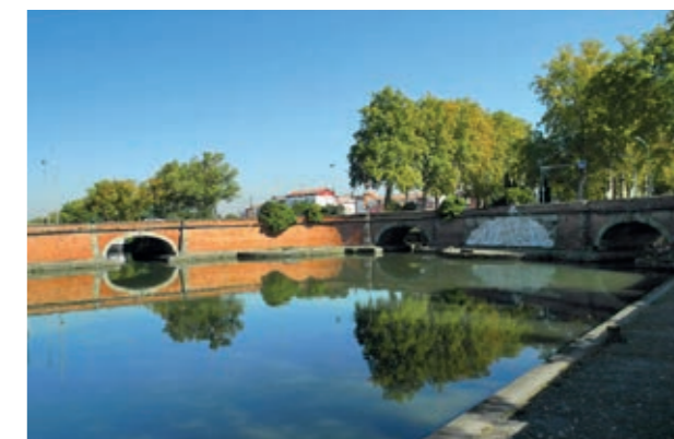
La prise d'eau à Ponts-Jumeaux

Chaque année de travaux d'entretien sont effectués sur toute la longueur du canal, c'est pourquoi les débits d'eau sont amenés à zéro en janvier et février cette période est appelé « le chômage du canal » ; tout prélèvement d'eau est interdit pendant cette période.