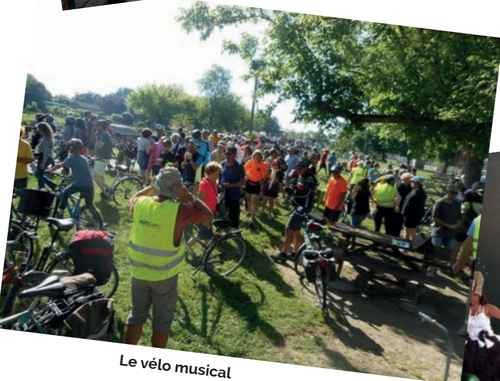
Le vélo musical