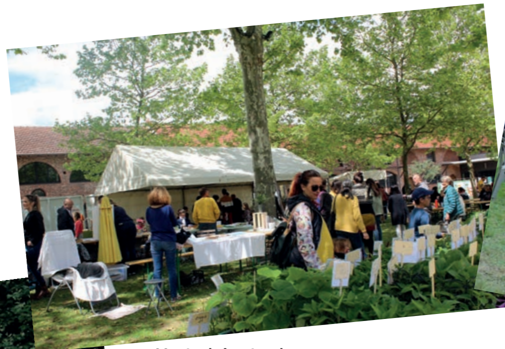
Montech ô naturel

Un programme varié de festivités a rythmé la saison estivale de notre commune. Merci aux associations et à toutes leurs équipes de bénévoles pour ces animations.