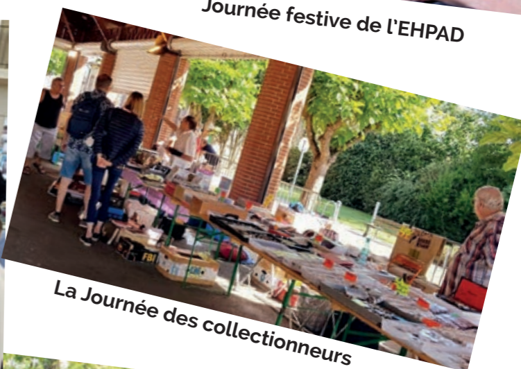
La Journée des collectionneurs