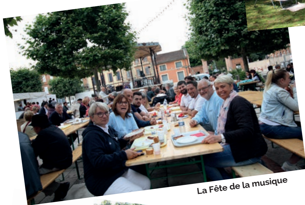
La Fête de la musique