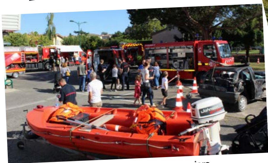
Portes ouvertes des pompiers