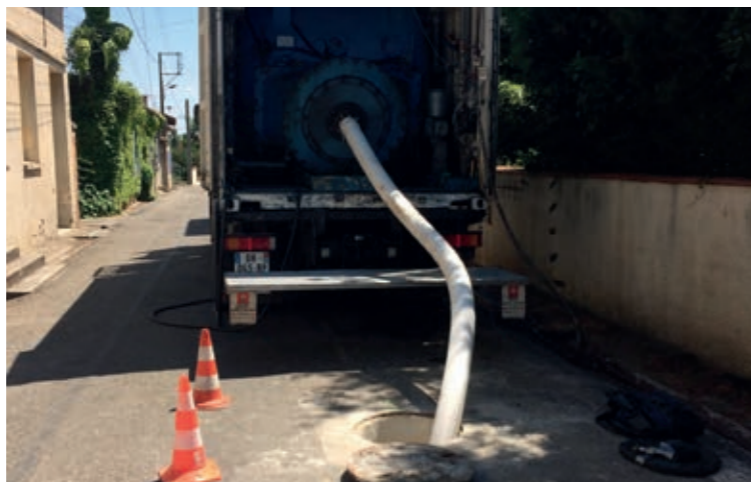
Chemisage d'une canalisation Eaux Usées

De gros travaux d'étanchéité des réseaux d'eaux usées ont été entrepris par la commune depuis 5 ans; ils permettent de réduire les infiltrations d'eau de pluie ou de nappes vers la station d'épuration. En effet, pour fonctionner correctement les bactéries d'épuration doivent recevoir une eau chargée suffisamment riche en matières organiques et non diluée par les eaux de pluie. De plus, les intrusions d'eau de pluie saturant la station et pourraient, dans un futur, contraindre la commune à augmenter sa capacité.