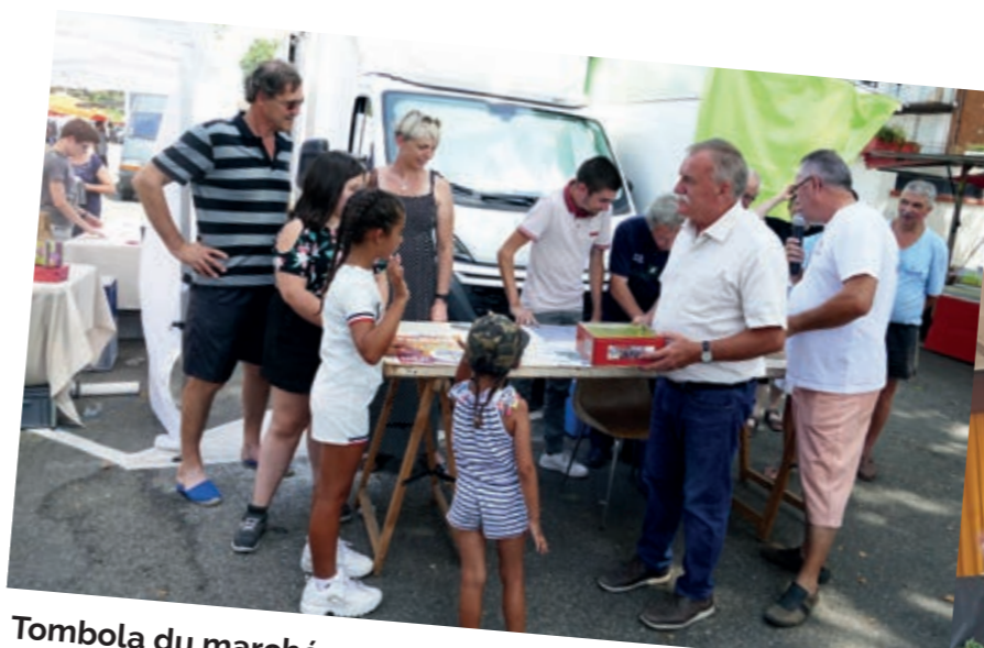
Tombola du marché