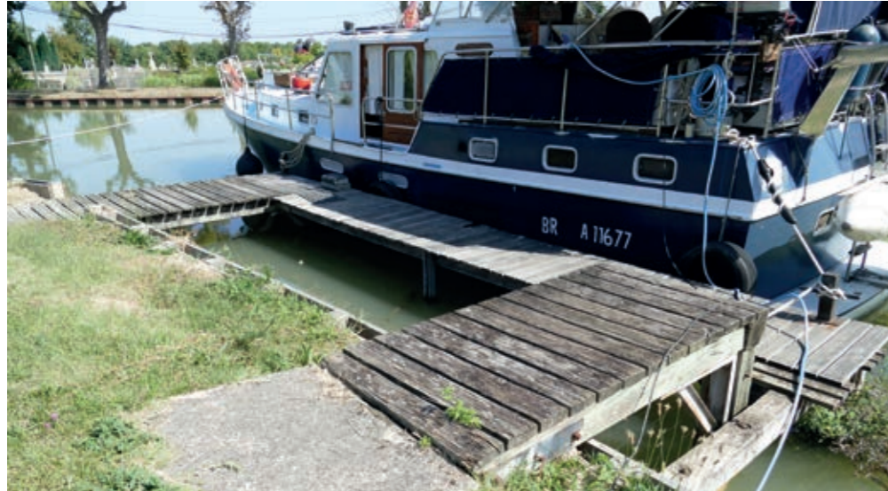
Ponton réalisé en palplanche bois

Il permet d'accueillir 35 bateaux ; depuis 2015 la plupart des places sont équipées de compteurs individuels de mesure de la consommation d'eau et d'électricité. En 2019, VNF a réalisé des travaux de rénovation des berges sur 20 mètres devant le syndicat d'initiative