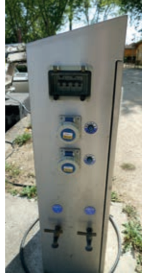
Borne individuelle pour l'eau et l'électricité

En hiver, le coefficient de remplissage est de 100 % (hivernage des bateaux) ; en été, il varie selon la navigation.