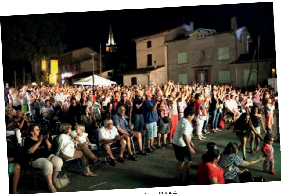
La tournée d'été