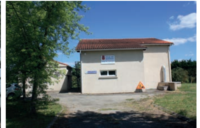
Usine de traitement de l'eau potable

Cette eau brute est acheminée vers la station de potabilisation de l'eau, construite en 1992. Le volume traité de 1300m 3 à 1500 m 3 /jour permet d'alimenter en eau potable les communes de Montech et de Finhan . Sous la responsabilité de la SAUR, l'eau pompée est décantée, filtrée puis parfaitement désinfectée.