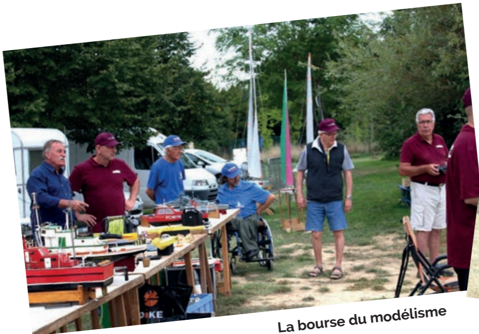
La bourse du modélisme