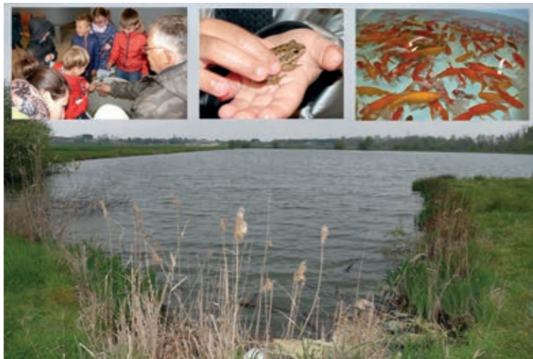
Etang de la pisciculture

Créée en 1950 par Louis CHAUDERON, elle est composée aujourd'hui de 27 étangs de 500 à 30000 m 2 . Alimentée par gravité par le Canal Latéral les étangs sont remplis chaque année en mars ; leur contenance est de 250000 m 3 . Chaque hiver les étangs sont complètement vidés ; l'eau de vidange s'écoule dans un ruisseau le Temborel qui passe sous le canal, et qui conflue avec la Garonne. Les poissons, gardons, tanches, carpes, sandres, brochets, ou poissons d'ornement (il n'y a pas de truites), élevés selon le principe semi-extensif, se nourrissent principalement de plancton.