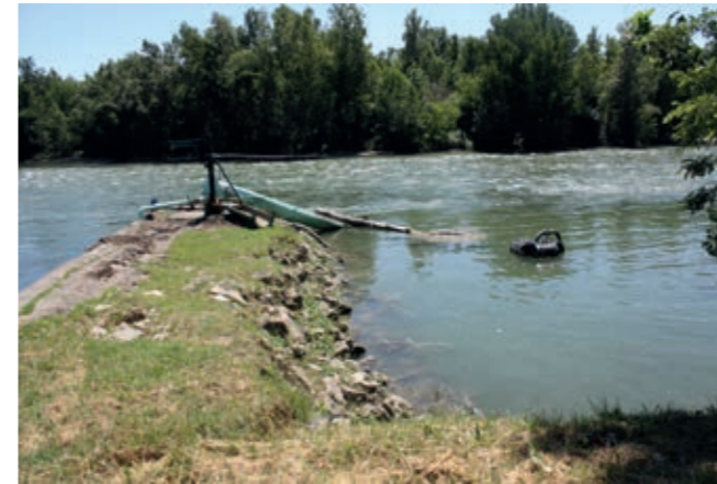
Mat et radeau de pompage en Garonne

La commune de Montech prélève l'eau brute via un groupe de 3 pompes immergées directement dans la Garonne .