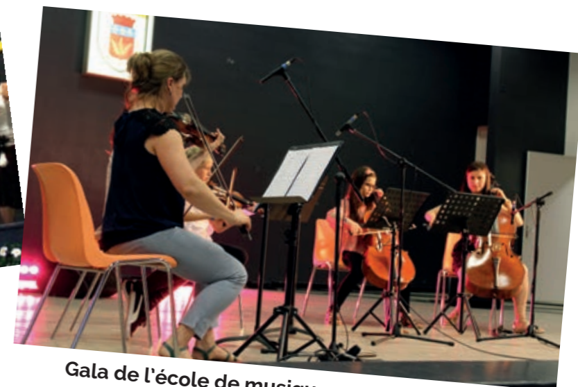
Gala de l'école de musique