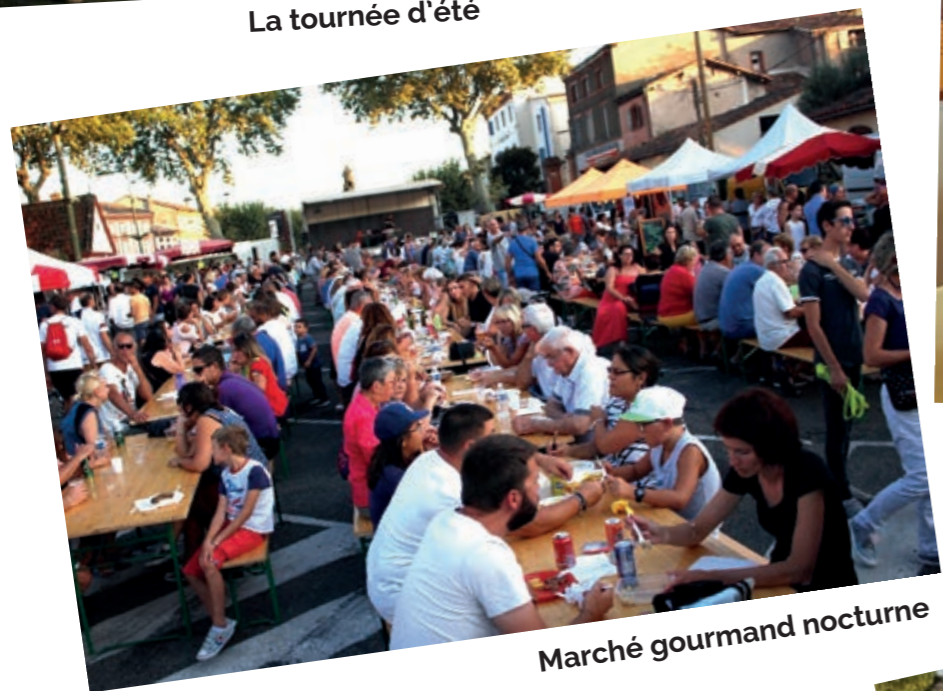
Marché gourmand nocturne