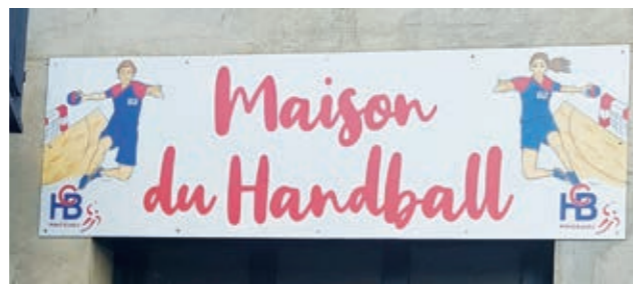
Panneau réalisé par Eyran BADUEL, membre du Handball Club Montéchois

Les clubs de basket et de rugby vont emménager chacune dans un nouveau club-house très bientôt pendant que le club de handball a intégré son club house dans l'ancienne maison du rugby.