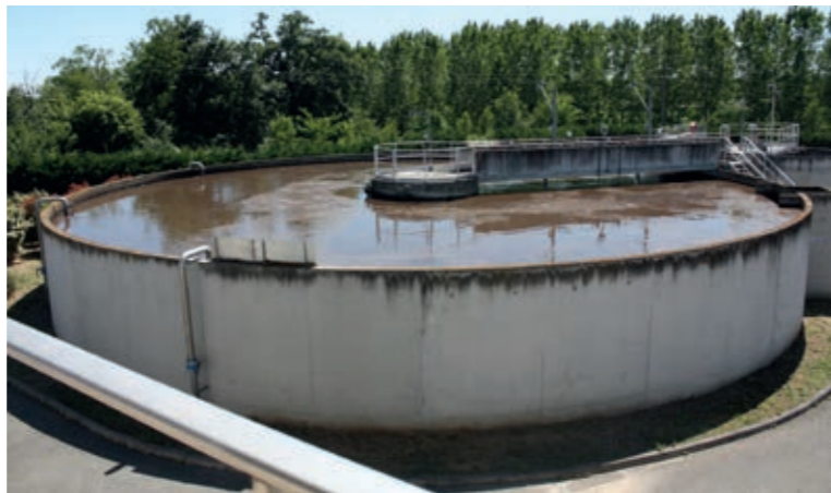
Station d'épuration – bassin d'aération et clarificateur

Construite en 2008, elle possède une autorisation de traitement de 13 000 équivalent habitants, avec une possibilité d'extension à 20 000 équivalent habitants, cette usine est suffisamment dimensionnée et située de façon à éviter toute nuisance .