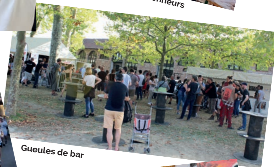
Gueules de bar