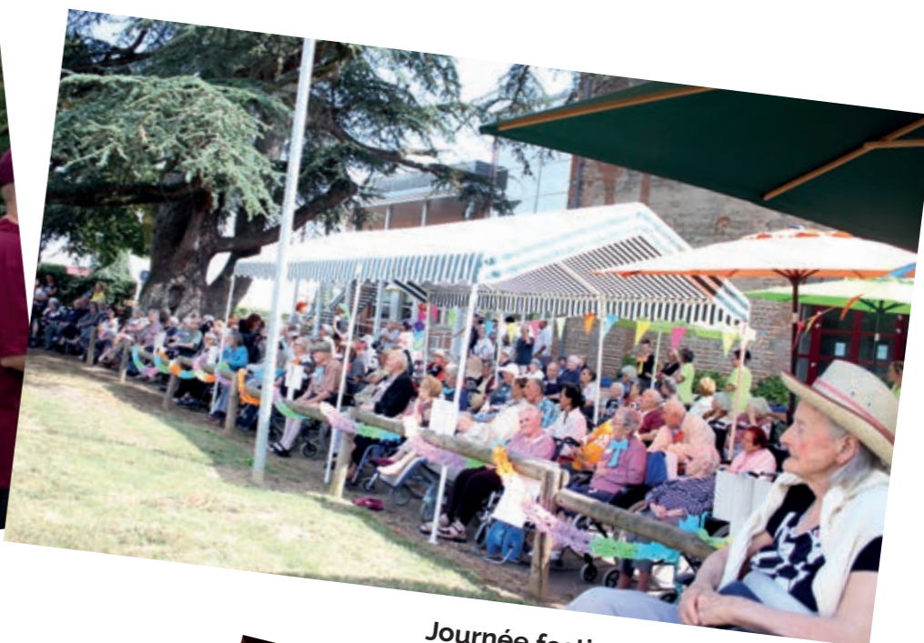
Journée festive de l'EHPAD